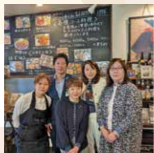
※写真は11/6村山地区開催の様子