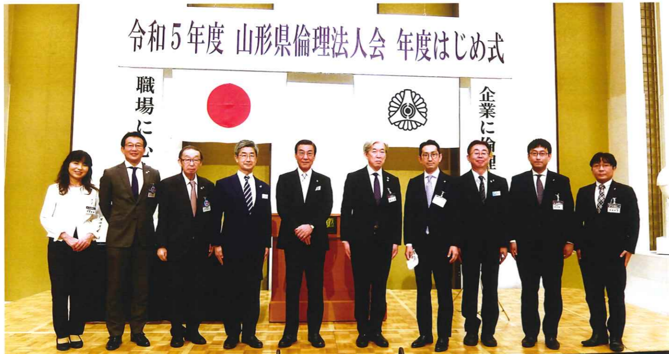
年度はじめ式(山形市蔵王倫理法人会参加役員)