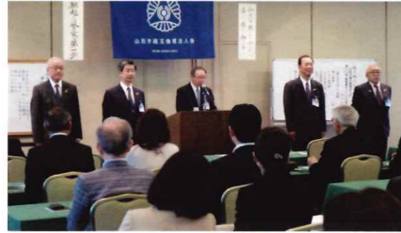
記念すべき第555回MSにて、歴代会長が勢ぞろい

山形市内にある3つの単会のうちの一つで、180社が山形市蔵王倫理法人会の仲間です。山形県内には、14の単会があり1568社が会員です。明朗・愛和・喜働の実践により、さらなる繁栄を目指す企業集団です。