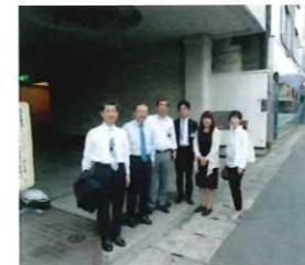
4月~10月まで、月に1回 モーニングセミナーの前に 会場周辺の清掃を行います。