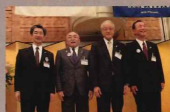
山形市蔵王倫理法人会歴代会長