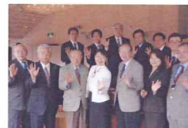
新たな展開！ すてきな集合写真♪

食事の後、皆で写真を撮りました。今まで講師と皆で楽しくポーズをとっての写真はなかったような・・・こんな笑顔あふれる写真が増えるといいですね。