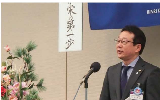
新年初回となった1月11日の経営者モーニングセミナー