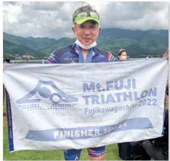
そのストイックさや情熱はまさに鉄人!

一般的なトライアスロンの場合は三〜四時間程度の競技ですが、アイアソンはその四倍以上。水泳三・八km泳ぎ、自転車一八十km走り、そこからフルマラソンで十六〜七時間かかるレースです。以前から参加して二〇一七年には完走できましたが、去年は十五分足りなくてリタイアしてしまいました。今年も五月オーストラリア