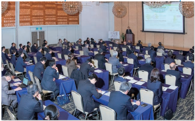
80名もの多くの方にご出席いただきました