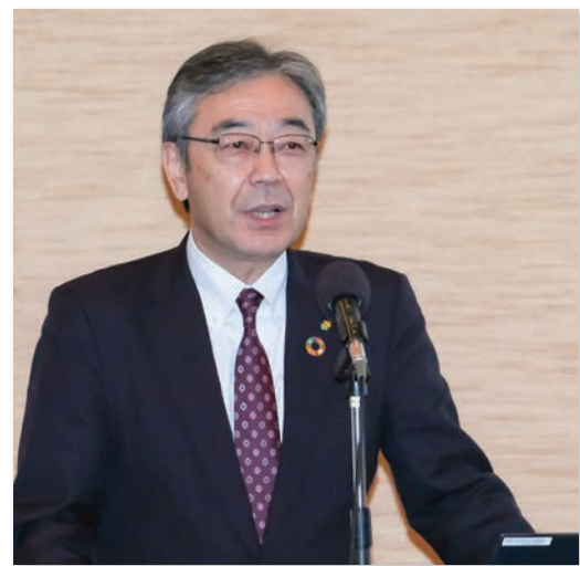
山形市蔵王倫理法人会会員 株式会社荘内銀行 代表取締役頭取