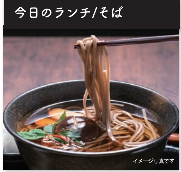
今日のランチ/そば