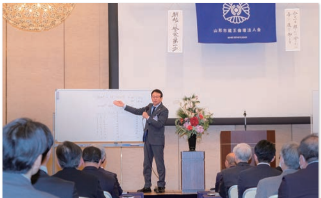
年末特別モーニングセミナーの会長挨拶